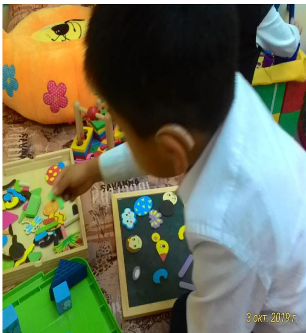
К. Умар --- 3 в класс Диагноз --ДЦП